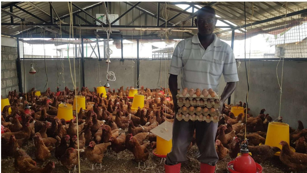
Kyllingene har vokst og har begynt å legge egg. Elevene får egg flere ganger i uken nå, noe de setter stor pris på. Igjen, tusen takk Hasle skole.